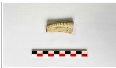
40. 개축 체성 기단보축