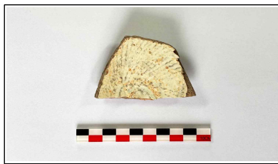
25. 초축 해자 내부토