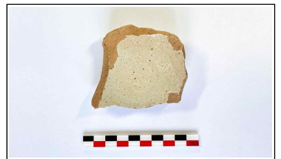
54. 개축 체성 채움석