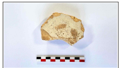
57. 개축 체성 채움석