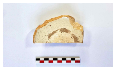
56. 개축 체성 채움석