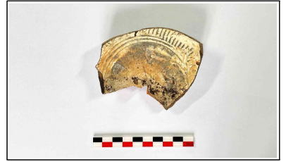
18. 초축 해자 내부토