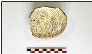
41. 개축 체성 기단보축