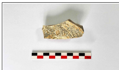
29. 초축 해자 내부토