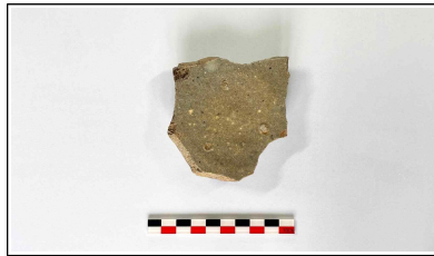
20. 초축 해자 내부토