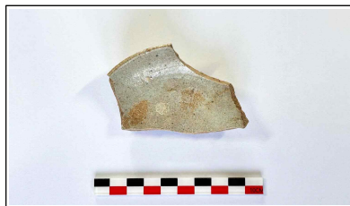
53. 개축 체성 채움석