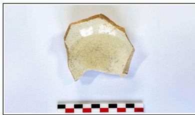
55. 개축 체성 채움석