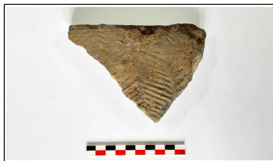
37. 초축 해자 내부토