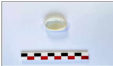
58. 개축 체성 채움석