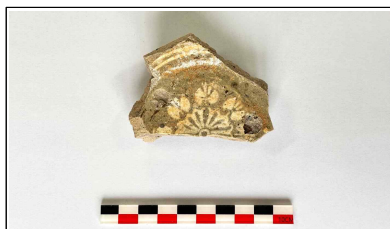
43. 개축 체성 기단보축