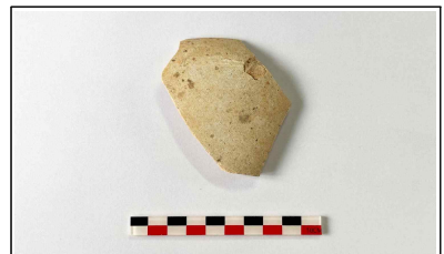
9. 초축 해자 내부토