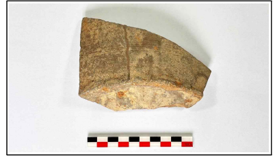
33. 초축 해자 내부토