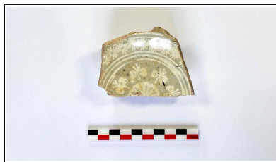
52. 개축 체성 채움석