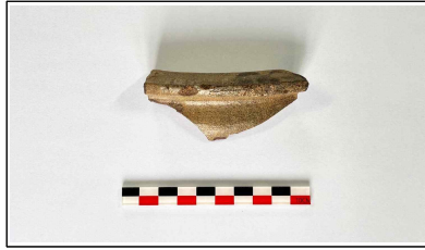
31. 초축 해자 내부토