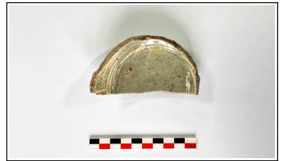
21. 초축 해자 내부토