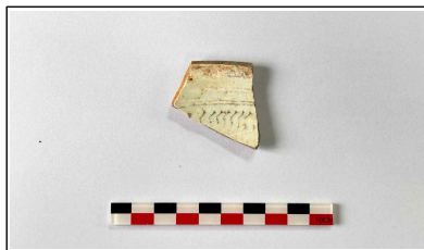
13. 초축 해자 내부토