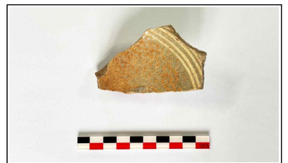
27. 초축 해자 내부토