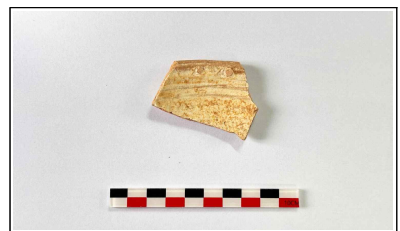
12. 초축 해자 내부토