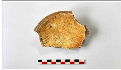
2. 초축 해자