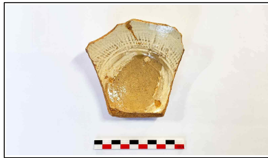
49. 개축 체성 기단보축