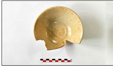
1. 초축 해자