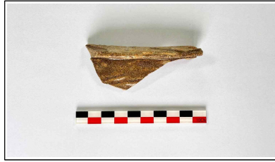
32. 초축 해자 내부토