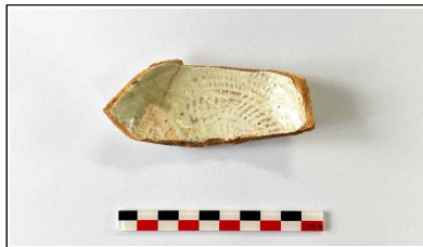
4. 초축 해자