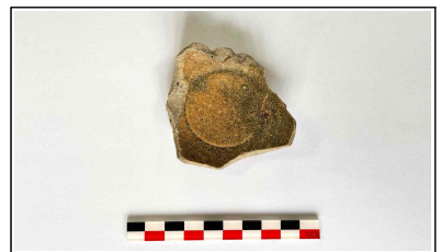
42. 개축 체성 기단보축