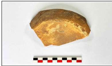
34. 초축 해자 내부토