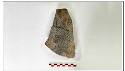
36. 초축 해자 내부토