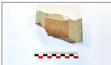
59. 개축 체성 채움석