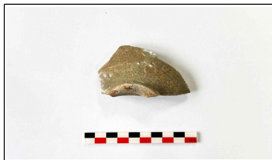
7. 초축 해자