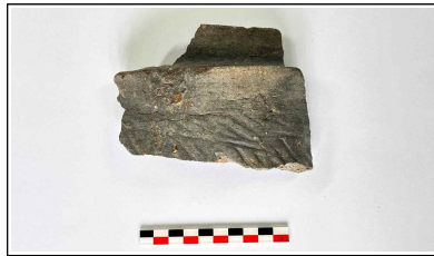
35. 초축 해자 내부토