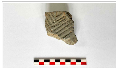
38. 초축 해자 내부토