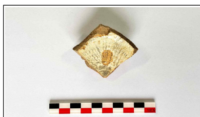
44. 개축 체성 기단보축