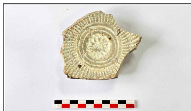
5. 초축 해자