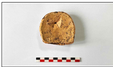
10. 초축 해자 내부토