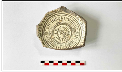
16. 초축 해자 내부토