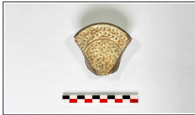
19. 초축 해자 내부토