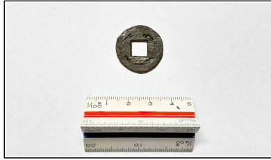
61. 개축 체성 채움석