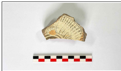
28. 초축 해자 내부토