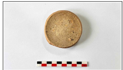
6. 초축 해자