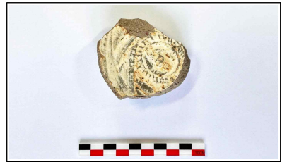
51. 개축 체성 채움석