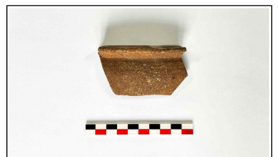
30. 초축 해자 내부토