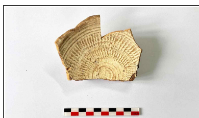
11. 초축 해자 내부토