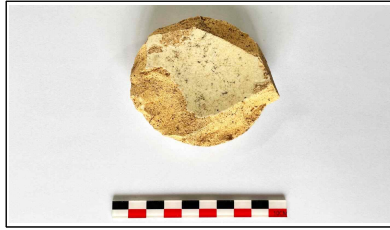
46. 개축 체성 기단보축