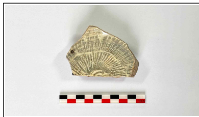
23. 초축 해자 내부토