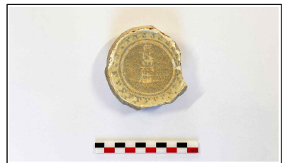
39. 초축 해자 내부토