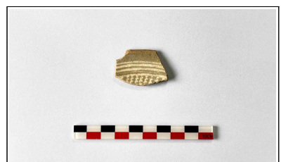
15. 초축 해자 내부토