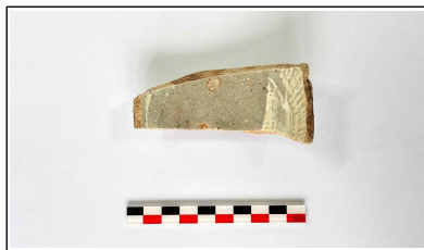
22. 초축 해자 내부토