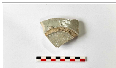
8. 초축 해자