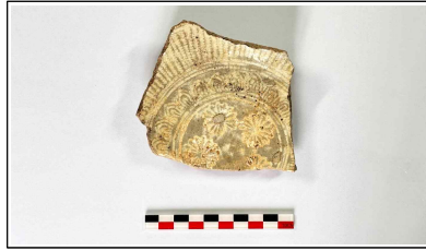
17. 초축 해자 내부토