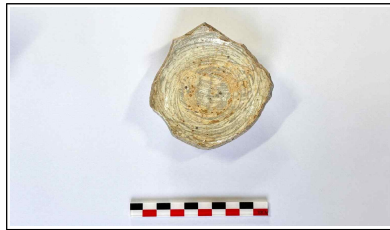
50. 개축 체성 채움석