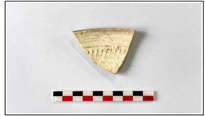
3. 초축 해자