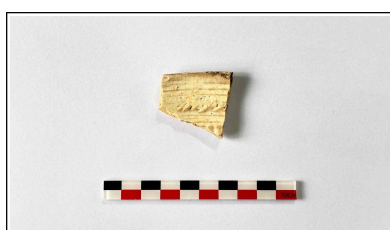
14. 초축 해자 내부토