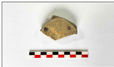
26. 초축 해자 내부토