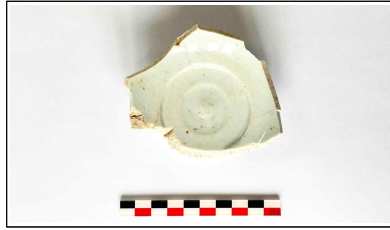
47. 개축 체성 기단보축