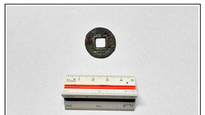
60. 개축 체성 채움석