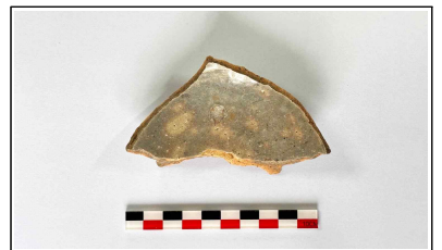
24. 초축 해자 내부토