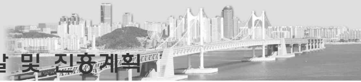
<그림 8-2> 관광권역 기능