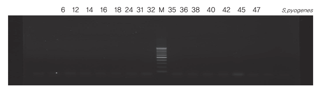
Fig. 6. PCR analysis of tet-S gene (667bp) from tetracycline resistant S. pyogenes.