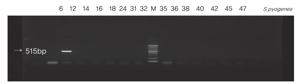
Fig. 5. PCR analysis of tet-O gene (515bp) from tetracycline resistant S. pyogenes.