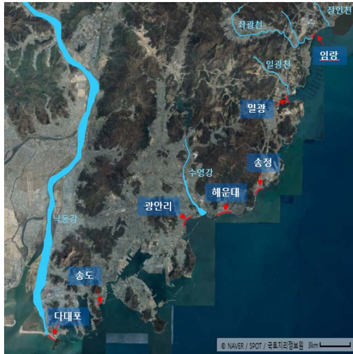
그림 1. 부산광역시 7개 해수욕장 위치도