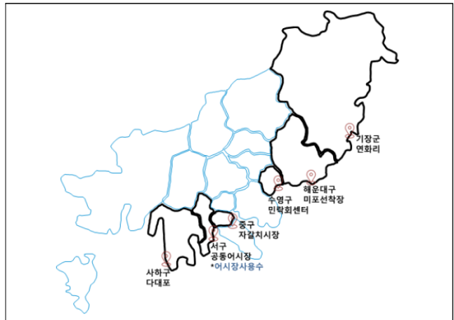
표 2. 해수욕장수 채취지점